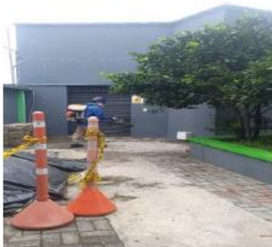
FUMIGACION SEDE- SENA LA CASONA