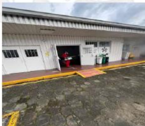
COMPLEJO DEPORTIVO CIENTIFICO

LLAMANOS Fijo: 824-71-21 Celi: 310-833-53-05