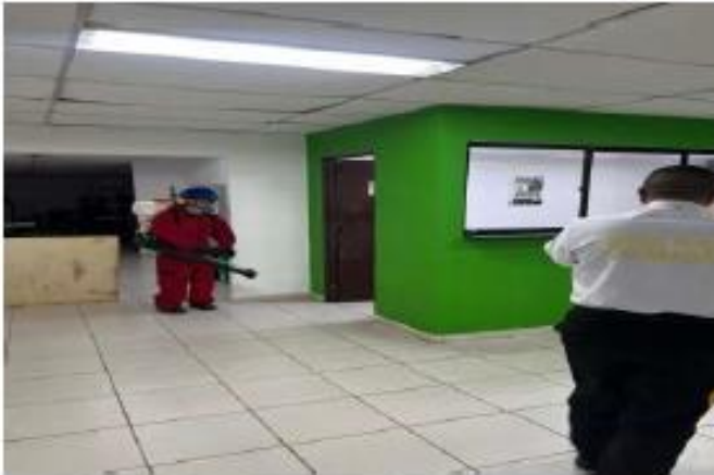
FUMIGACION EN SENA CIUDAD JARDIN BASURAS

FUMIGACION EN SENA- CIUDAD JARDIN MAYO 16 DE 2026